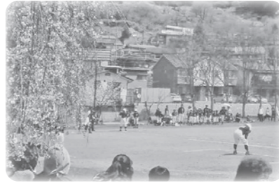
少年野球 (高浜運動公園)

れません。仕事柄、町の中をてくてく歩くことが多いのですが、知らない道、知らない場所の多いことに気づかされます。発見できる宝がいっぱいのお町、家族と、友だちと、イベントも利用して、たくさん歩きたいですね。住む人も町そのものも健康で長生きできるように、町の皆さんで考えを出し合い、自分たちの町の将来を人任せにせず、力を出し合っていけたらいいなと思います。若い人たちは、人生の先輩である方々を敬い、ご年配の方々には、まだまだ未熟な若者たちを温かく指導し見守っていただいて(ずうずうしい!!)、仲良く暮らしていいから嬉しいです。